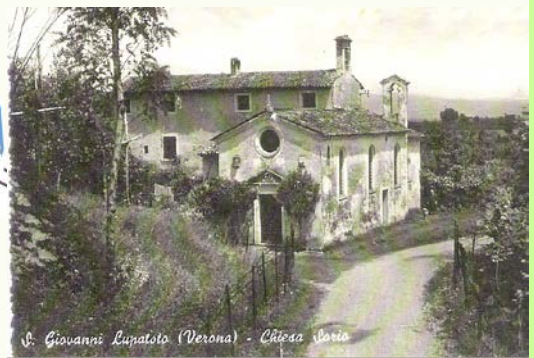
S. Giovanni Lupatoto (Verona) - Chiesa Sorio

La chiesetta di Sorio, intitolata prima a San Pietro da Verona e più tardi alle Vergine Assunta costituisce il luogo di culto più antico della storia del territorio di San Giovanni Lupatoto. Risale probabilmente al secolo XII.